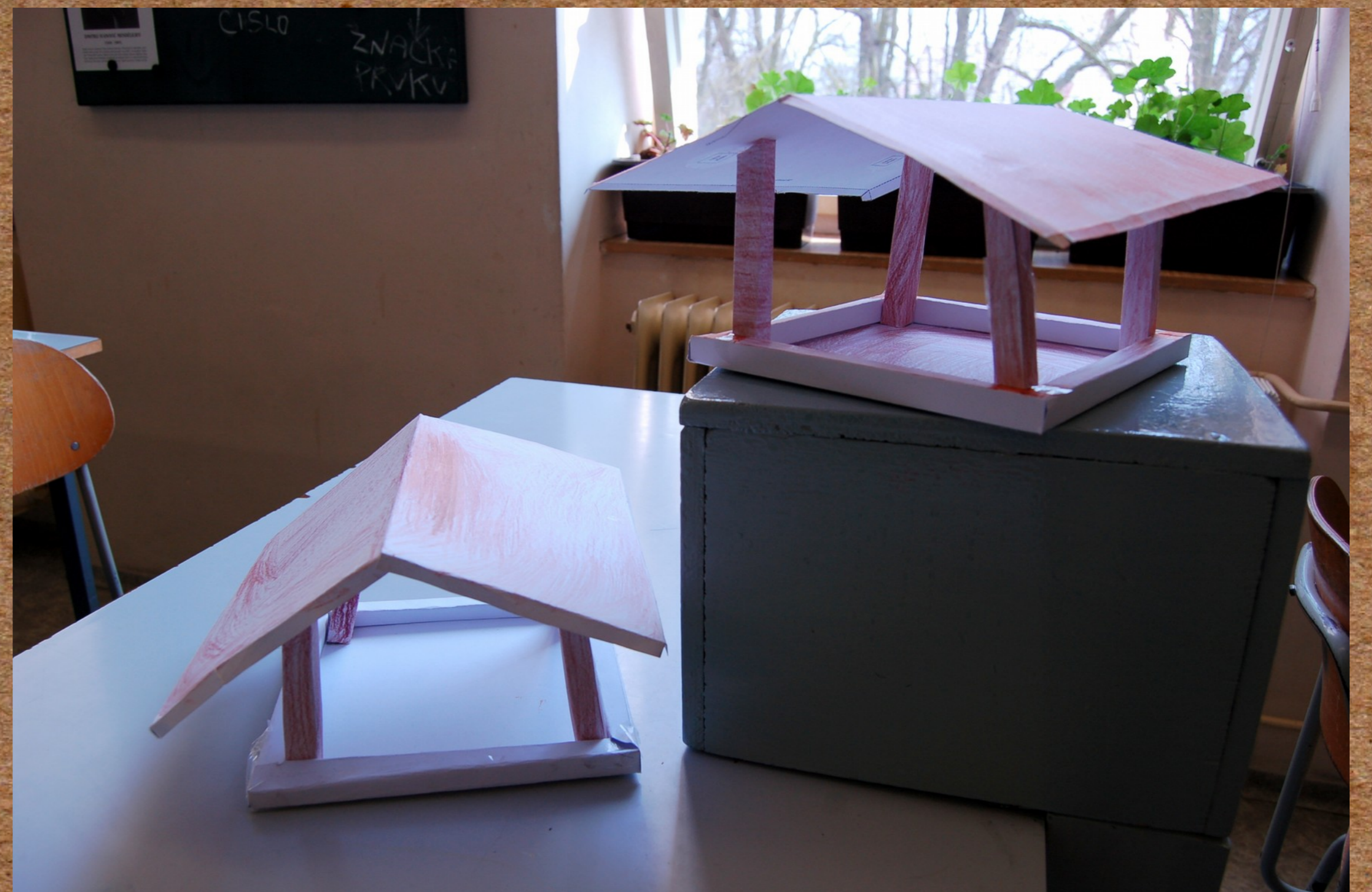
Modely ptačích budek (Nezvěstice)