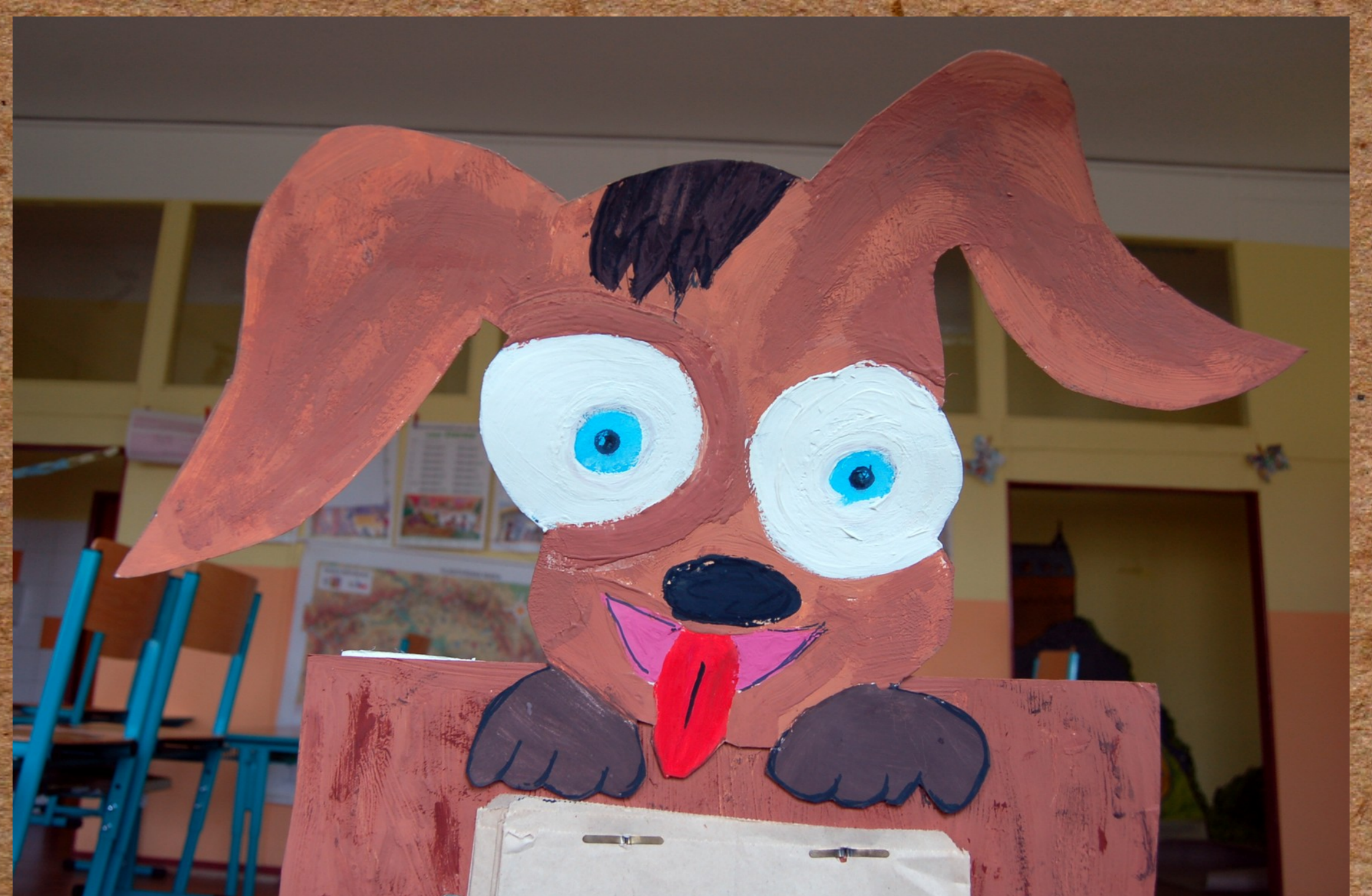
Uklidiš po mně?! (Dolní Lukavice)