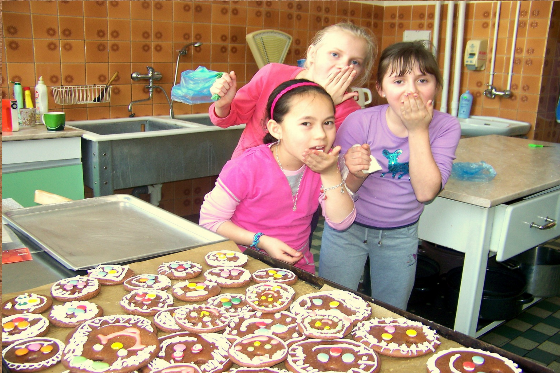
Chystáme svačinku pro děti z mateřské školy (Chocenice)

Děti pečlivě prozkoumaly obce, ve kterých se nachází jejich škola. Pojmenovaly problémy a pomocí projektového vyučování navrhly jejich řešení. Všechny dětské projekty směřovaly k tomu, aby se zvýšila kvalita životního prostředí v obci.