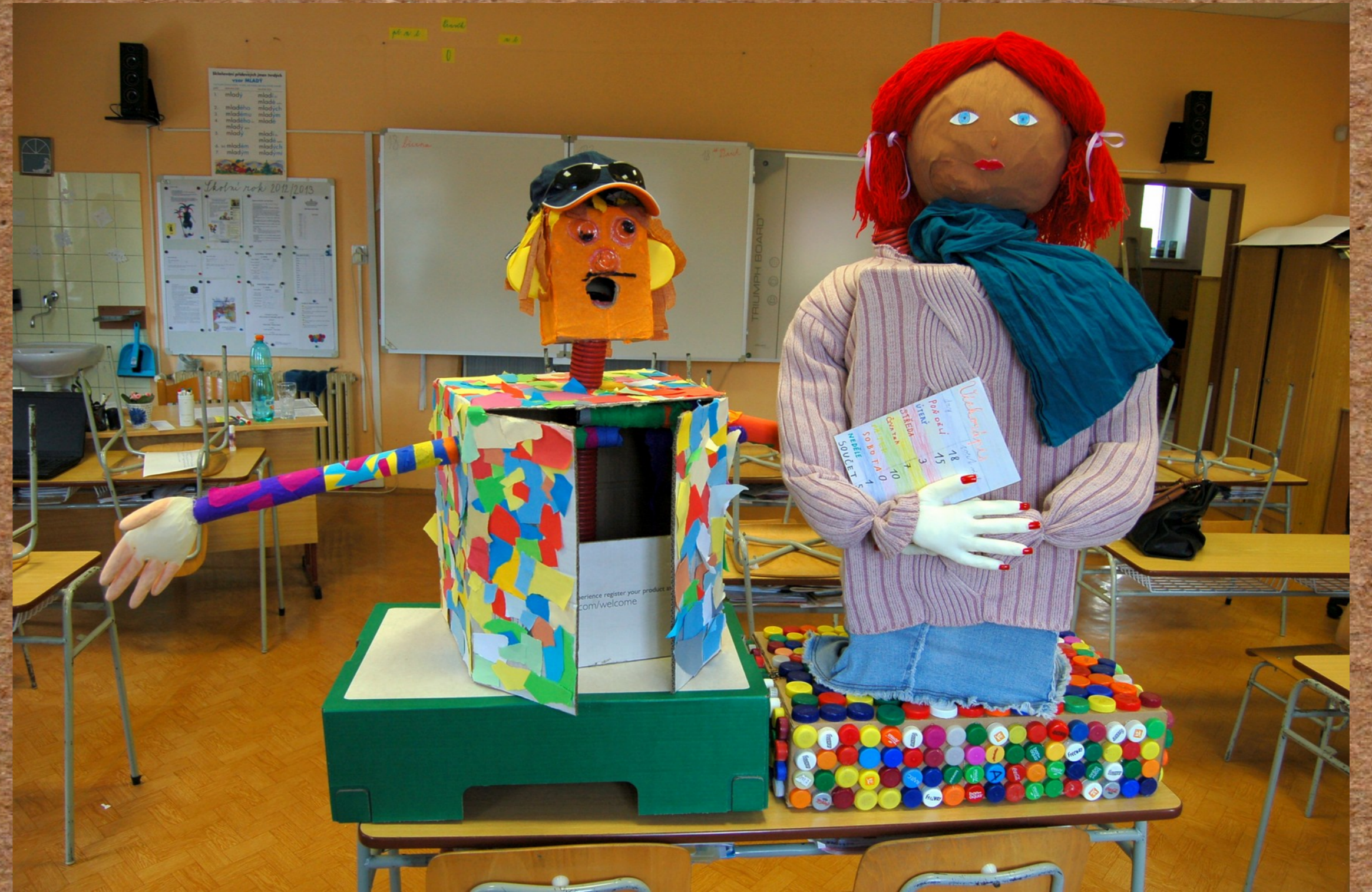
Sbírejte ta víčka s námi! (Řenče)